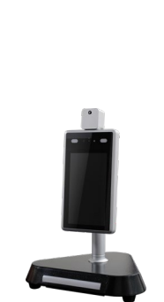
卓上スタンド <NSACE001> W283×H38×D260mm 参考価格: 13,200円(税込)