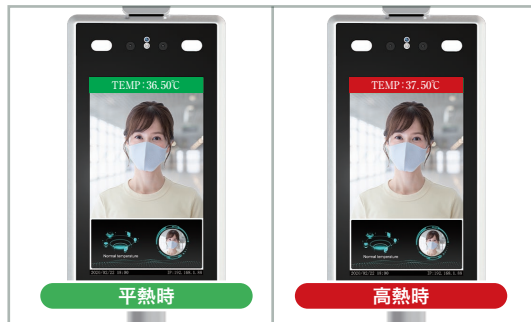
※画像は「NSAC-TH1001」製品の表示となります。

※体表面温度測定のみでの使用もできます ※表面温度分布を測定する機器ですが、体温計等の医療機器ではありません