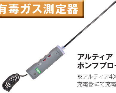
アルティア ポンプローブ